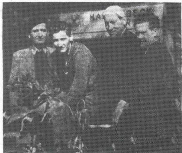
Radsport-Dokument mit nostalgischem Wert