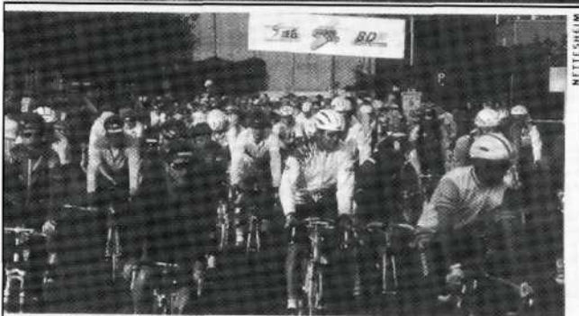
Der Sonne entgegen: Start der 750 Super-Cup-Fahrer in Bremen