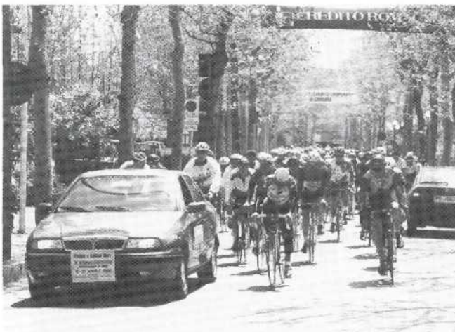
Start bei der „15. Settimana Cicloturistica“ 1995. Gabicce Mare ist für viele Breitensportler auch der Start in eine erfolgreiche Radsportsaison.

„Nun kommt der Tagesordnungspunkt 'Volksradfahren' zur Sprache. Kamerad Mauch gibt bekannt, daß sich das Volksradfahren großer Beliebtheit erfreut. Unser Sportbetrieb ist in drei große Sparten aufgeteilt: a) der Breitensport, b) der Leistungssport, c) der Spitzensport. Der DSB hat neuerdings dem Breitensport große Beachtung geschenkt. Hier steht besonders die Trimmaktion im Vordergrund. Ferner hat der DSB einen Ausschuß für Volksveranstaltungen gebildet, dem vom BDR Herr Mauch angehört. In einer Sitzung des Ausschusses vor wenigen Tagen wurden festgelegt, daß der DSB Medaillen für Volkssportveranstaltungen in sehr großer Anzahl herstellen lassen will, um so einen äußerst günstigen Preis zu erzielen. Die eine Seite der Medaille wird ein einheitliches Emblem tragen, die Rückseite bleibt für örtliche Belange etc. frei. Da in Sachen Breitensport sehr viel Arbeit auf uns zukommen wird, bleibt es nicht aus, hier ebenfalls