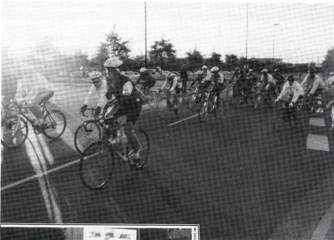
Start im Morgengrauen ... Rund 750 Teilnehmer machten sich am Morgen des 31.05.1997 auf, die 290-km-Strecke des 2. Bremer-Roland-Super-Cups zu bewältigen.