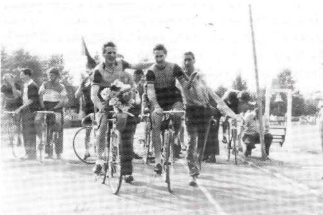
8 Aschenbahn-Siegerehrung Ende der 50er Jahre.