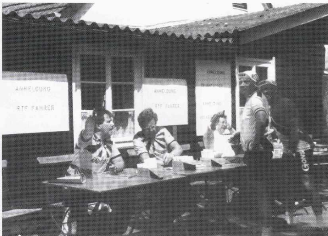
Tabelle: BRV/W. Wehrs