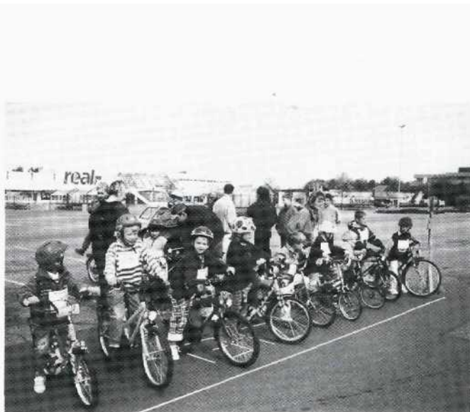
Kinder- und Jugendrennen auf dem real,-Parkplatz in Bremen-Habenhausen.

Geselligkeit wird im RSC Rot-Gold groß geschrieben. So findet jährlich zum Saisonbeginn ein „Italienisches Essen“ statt, bei Vereins-Wochenendfahrten wird das Gruppenfahren und die Kommunikation gepflegt und die jährliche Abschlußfeier zum Jahresende dient der Bekanntgabe der Wertungspunkte, der Pokalausgabe und Ehrung sowie der Reflexion der abgelaufenen Saison.