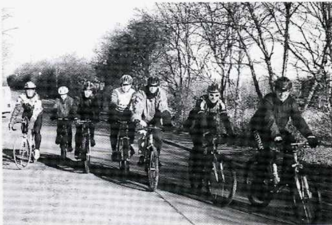
Jugendtraining findet auch im Winter statt, Februar 1997.