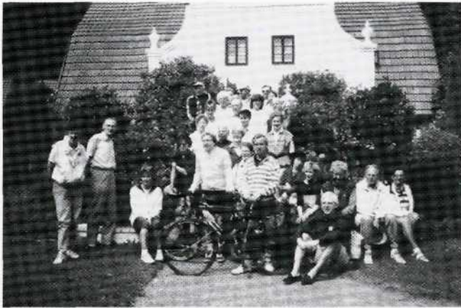
Gruppenbild mit Rad ... Pause auf einer Radwandertour 1996, die nach Worpswede führte.