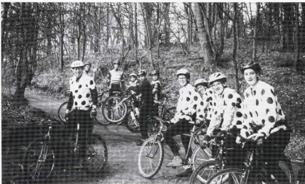
Jugendreise nach Dudley/England 1996, vorne die Partnergruppe der „Black Country Wheelers“