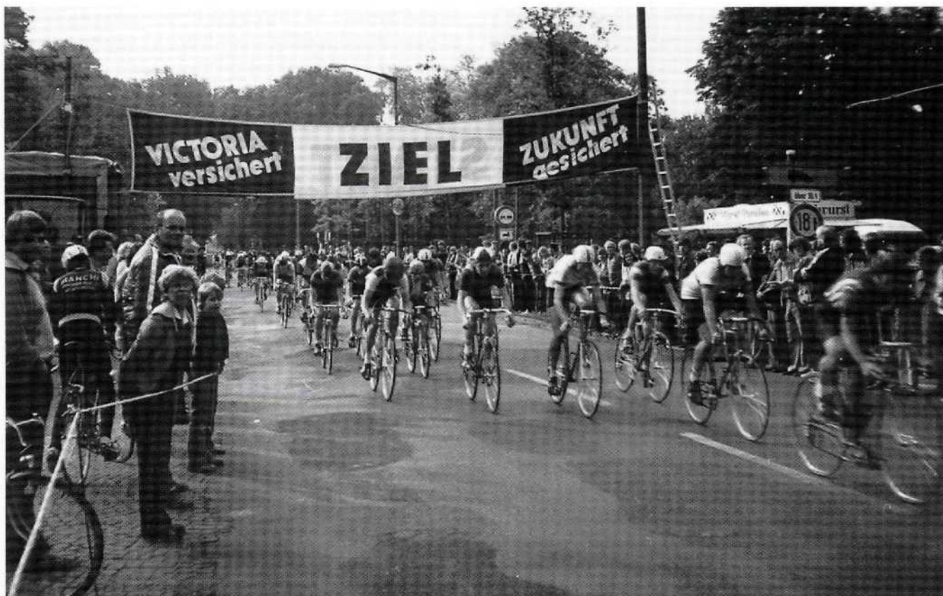
Richtige Radrennatmosphäre beim ersten Bürgerparkrennen 1980. Diese Atmosphäre gibt es zur Zeit nur noch bei den Sechstage-Rennen.

Bei den Cross-Meisterschaften am 11.12.88 in Tretz erreichten die Aktiven folgende Ergebnisse: