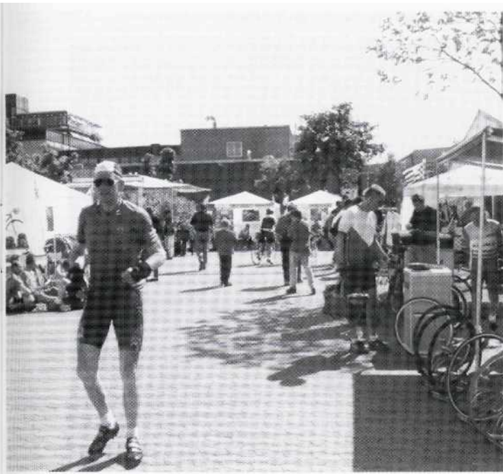
2. Bremer-Roland-Super-Cup, 31. Mai 1997. Die ersten „Marathonis“ rollen wieder im Start/Zielbereich ein, wo Händler und Hersteller von Radsportbedarf sich in einer kleinen Zeltstadt präsentieren.