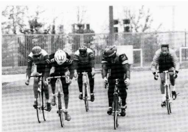
Sprint bei der Vereinsmeisterschaft 1996 im Bauerland

Seit 1993 führt der Verein als interne und spaßorientierte Aktivität eine Vereinsmeisterschaft